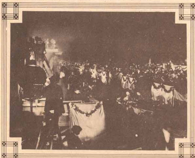
FILMANDO MINHA ESPOSA MODELO, DA PARAMONT.

A inspecção do film, pois, ao ser recebido e ao ser enviado, deve ser feita obrigatoriamente e com todo o cuidado.