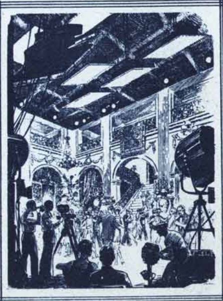
COMO É FILMADA UMA SCENA DE BAILE.

Por isso mesmo, em certas projecções o quadro projectado soffre muitas vezes grandes differenças na iluminação, o que provoca as reclamações do publico.