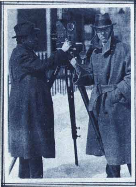
GRIFFITH, AO FILMAR "HORIZONTE SOMBRIO", DA UNITED ARTISTS.

A lubrificação do aparelho projector é cousa merecedora dos maiores cuidados por parte dos operadores. Em períodos determinados, regularmente, periodicamente, o aparelho deve ser limpo e cuidadosamente lubrificado, não se devendo esperar que o mau funcionamento exija esses cuidados.