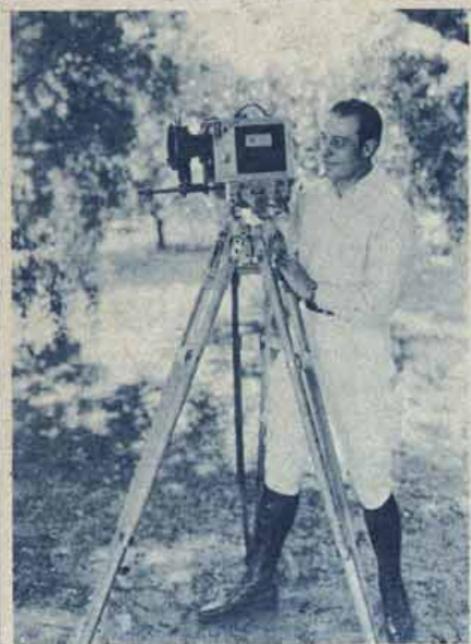
VALENTINO ERA UM GRANDE AMADOR DE CINEMATOGRAFIA. AQUI ESTÁ ELLE COM A SUA DEBRIE.

O calor produzido pelo condensador de raios luminosos é muito considerado. O film é essencialmente inflammavel, dadas as substancias que entram em sua composição. Se não fosse o rapido movimento de translacção que elle soffre de um para outro deposito, a concentração dos raios caloriferos do condensador produziria a sua ignição fatalmente. Sabe-se como é frequente isso, apesar de todos os cuidados empregados. Por isso mesmo em varios paizes ha legislação especial para as casas de exhibição cinematographica, expostas a incendios em virtude da inflammabilidade da pellicula, sempre exposta a pegar fogo por sua proximidade do fóco luminoso.