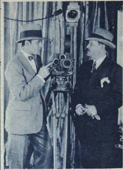
DANDO UMA PEQUENA LIÇÃO A BELTRAMMASSES, ARTISTA.

mittia a parada do film é a projecção fixa por varios minutos, sem perigo de combustão.